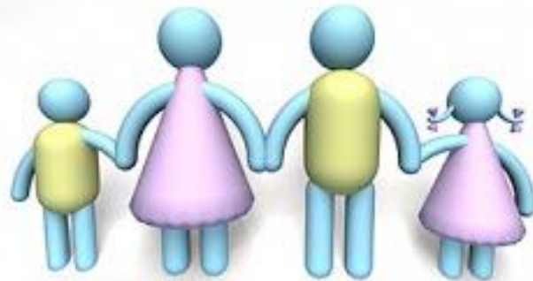
Asociación Padres de Familia